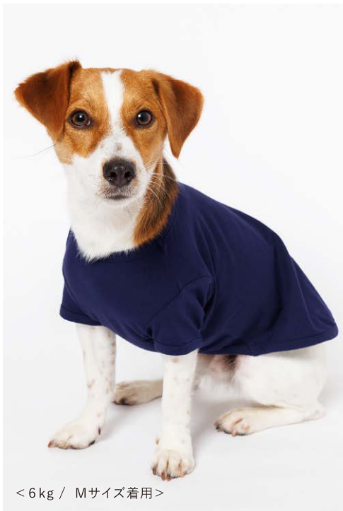
< 6 kg / Mサイズ着用 >