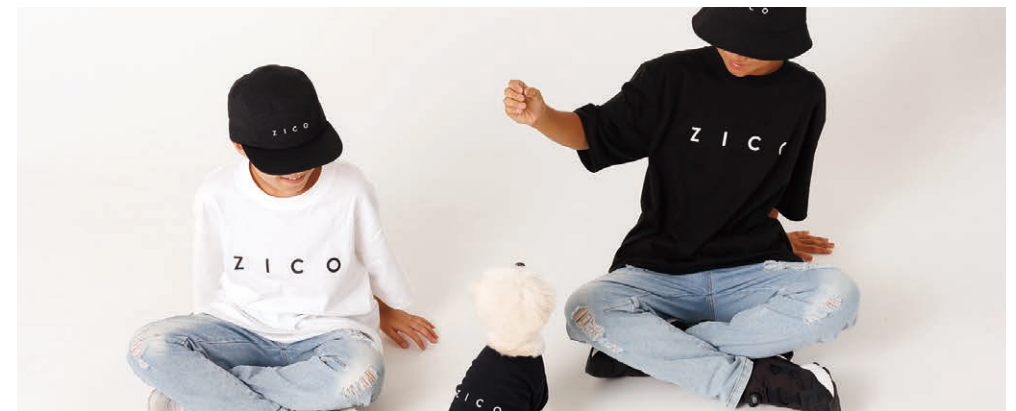
お客様のリンクコーデデザイン