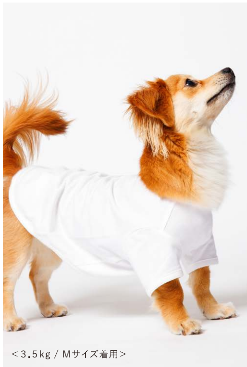
< 3.5 kg / Mサイズ着用 >