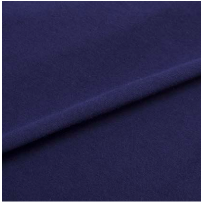
PET NO SLEEVE T / PET HALF SLEEVE T