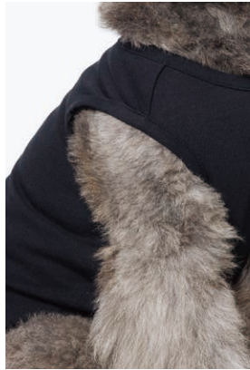
PET NO SLEEVE T / PET HALF SLEEVE T / PET HALF SLEEVE FRENCH TERRY PARKA