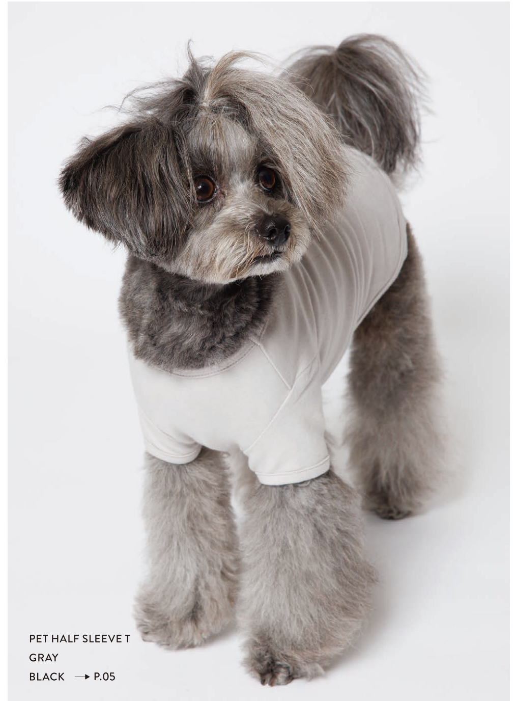
PET HALF SLEEVE T GRAY BLACK → P.05