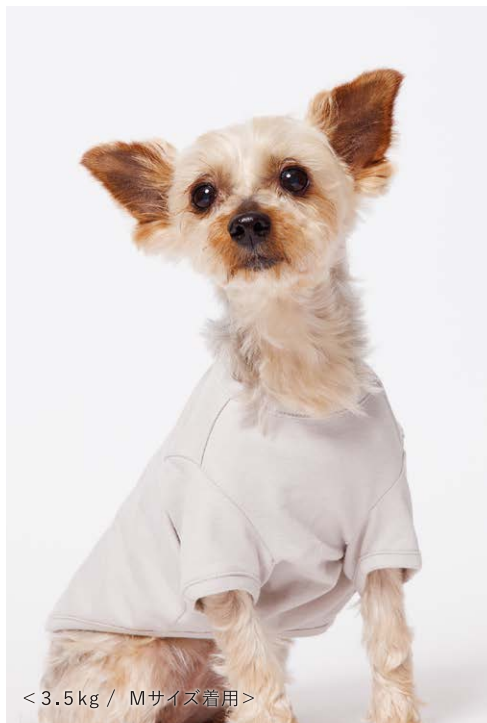
< 3.5 kg / Mサイズ着用 >