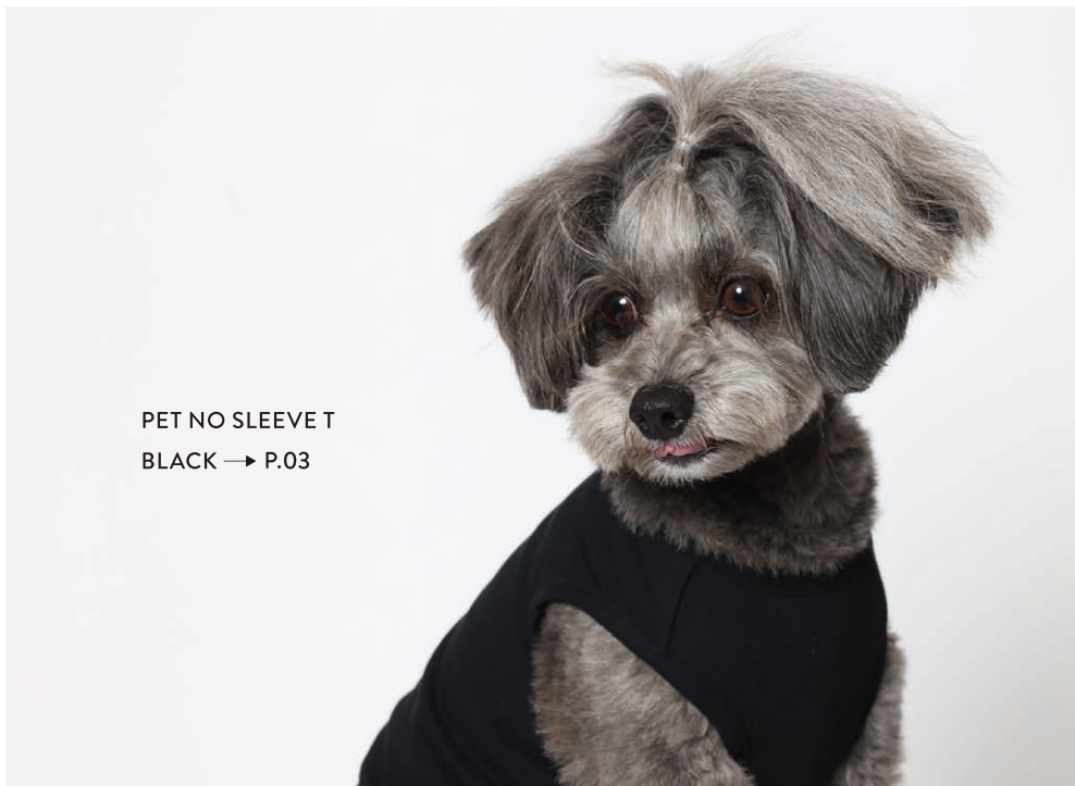
PET NO SLEEVE T BLACK → P.03