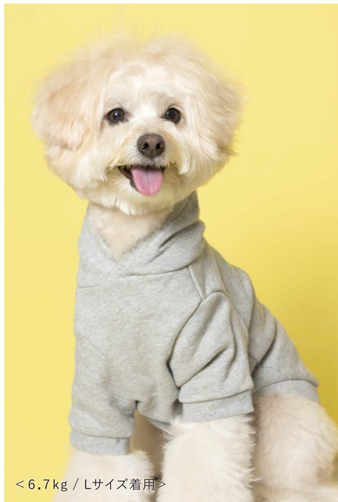
< 6.7 kg / Lサイズ着用 >