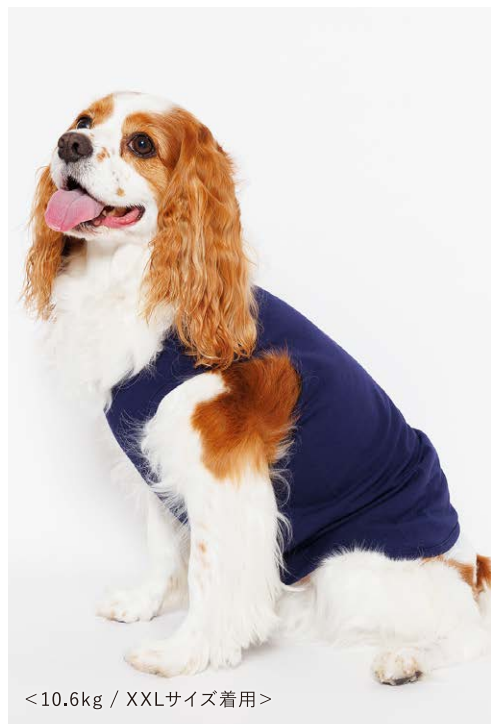
<10.6kg / XXLサイズ着用>