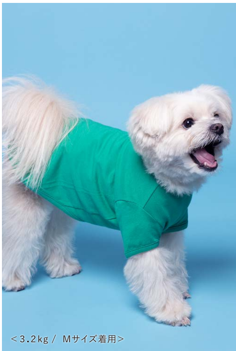
< 3.2 kg / Mサイズ着用 >