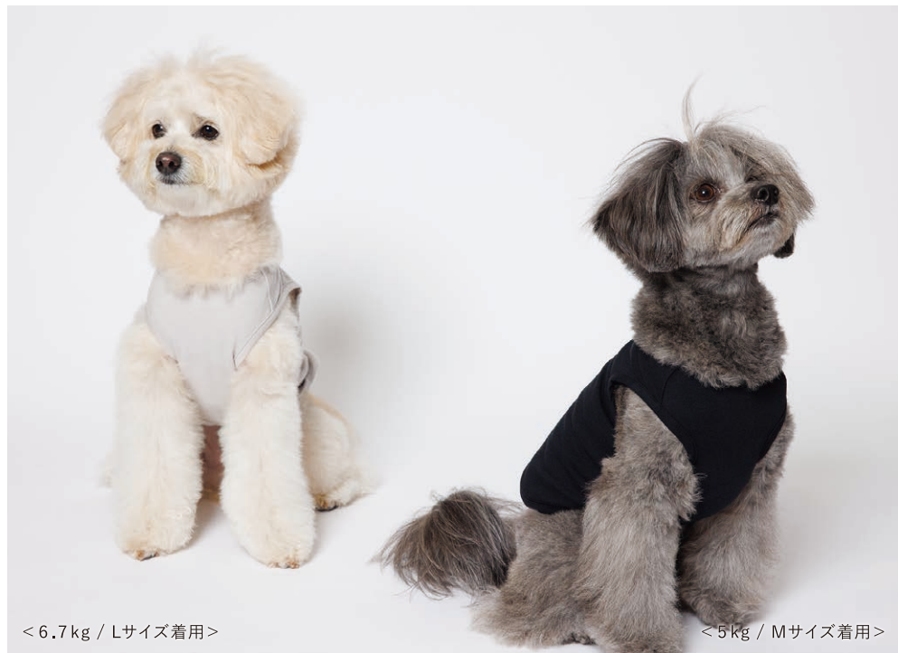
<6.7kg / Lサイズ着用>

綿のナチュラルな風合いを生かし、軽さとしなやかな伸び、回復性を兼ね備えたノースリーブTシャツ。着用しやすい造形で、オールシーズン対応の無地のベーシックタイプです。