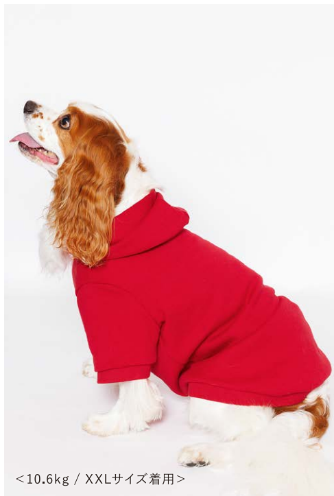
< 10.6 kg / XXLサイズ着用 >