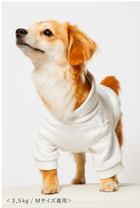
< 3.5 kg / Mサイズ着用 >

軽さやストレッチ性を兼ね備えたハーフスリーブフレンチテリーパーカー。編み設計などを工夫し裏パイルによって保温性と保湿性を高めました。パイル地の特徴から軽く吸水性もあり動きやすいのもポイント。毛焼き加工にてクリアな表面感を表現した無地のベーシックタイプです。