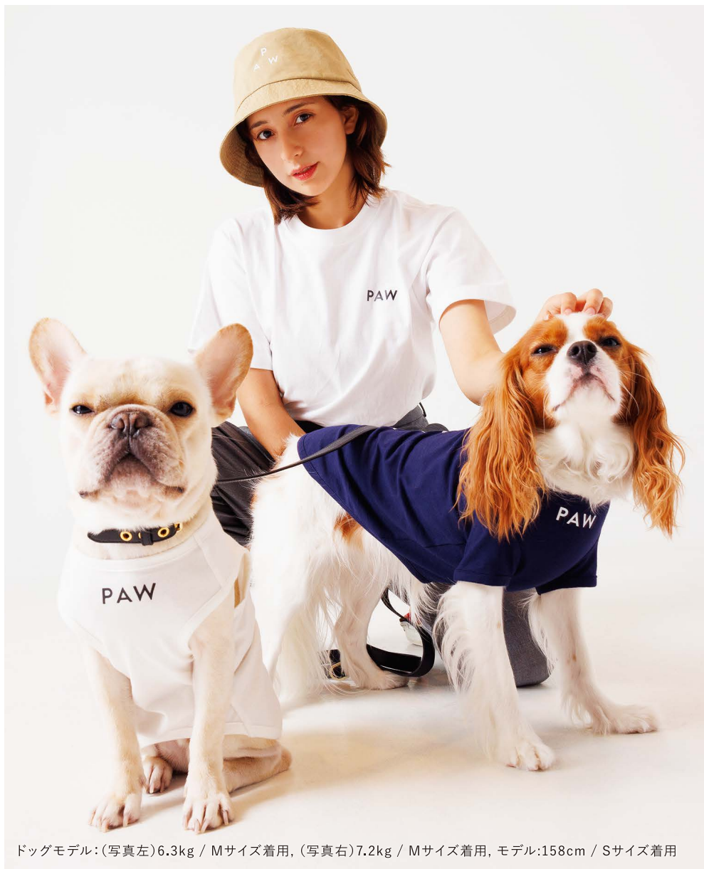
ドッグモデル：(写真左)6.3kg / Mサイズ着用、(写真右)7.2kg / Mサイズ着用、モデル:158cm / Sサイズ着用