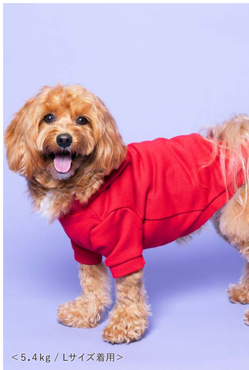
< 5.4 kg / Lサイズ着用 >