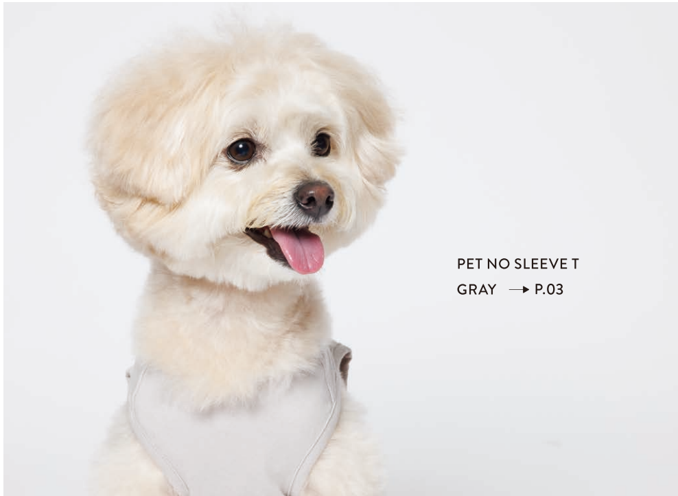
PET NO SLEEVE T GRAY → P.03