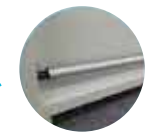
より安定した巻き取り